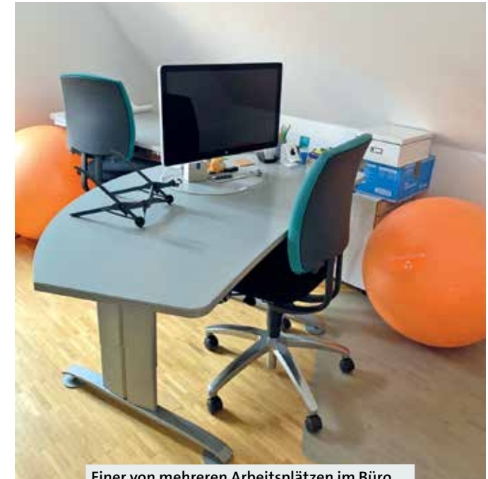
Einer von mehreren Arbeitsplätzen im Büro mit höhenverstellbarem Schreibtisch.

„Stunden-, tage- oder monatsweise – alles ist möglich“, so Peter Finke. „Immer inklusive Kaffee und Wasser, Nutzung des Farbdruckers sowie des Turboscanners. Jeder Arbeitsplatz verfügt über einen höhenverstellbaren Schreibtisch. Und das Wichtigste: ein redundanter Highspeed-Internetzugang.“ Außerdem: Relaxmöglichkeiten (wer hart arbeitet, hat Pausen verdient), eine komplett ausgestattete Küche, eine gemütliche Sitzecke und eine „coole Terrasse“ zum Draußen-Arbeiten.