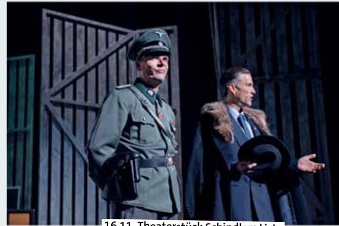
16.11. Theaterstück Schindlers Liste