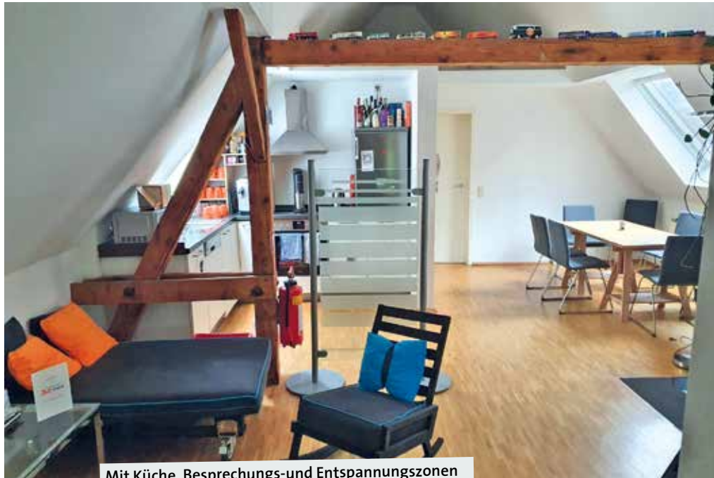
Mit Küche, Besprechungs- und Entspannungszonen ist die Etage komplett ausgestattet.