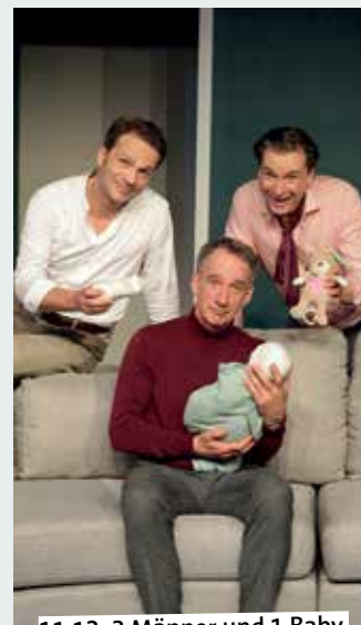
11.12. 3 Männer und 1 Baby

Tag die Verwandlung in ein echtes Burgfräulein oder in einen echten Ritter nicht fehlen, deshalb dürfen sich die Kinder und die Erwachsenen nach Herzenslust verkleiden. Damit dieser gelungene Nachmittag nicht so schnell in Vergessenheit gerät, können die Großeltern natürlich Fotos von den kleinen Rittern und Burgfräulein machen. Burg Vischering