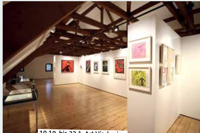
10.10. bis 22.1. Art Vischering

Fotos Veranstaltungskalender: Veranstalter und Agenturen