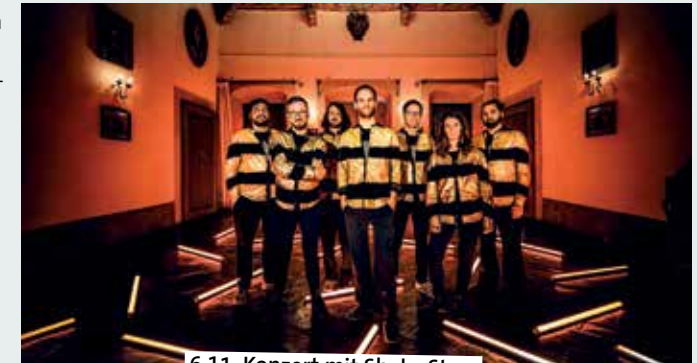
6.11. Konzert mit Shake Stew

19.30 – Märchenabend: Kommen. Lauschen. Staunen! Die Zuhörer erwartet ein erstaunlicher Abend, an dem z.B. „Die Geschichte von Kunz und seinem Schäfer“ aus dem Maassebuch und „Das Hirtenbüblein“ von Grimm vorgetragen werden. Auch Martin Bubers „Das Gebot der Liebe“ wird zu hören sein