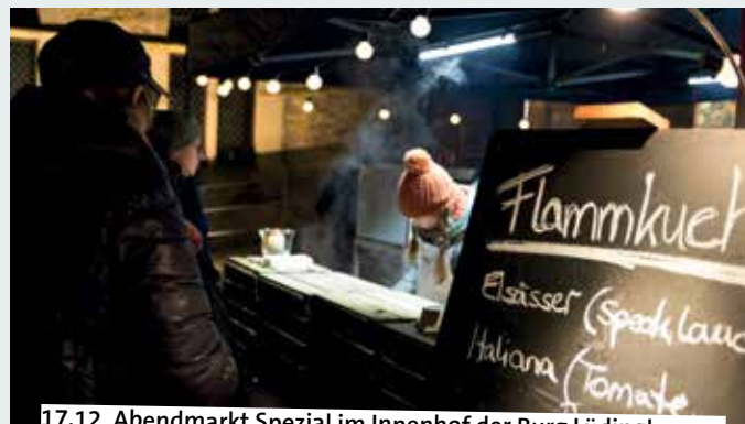
17.12. Abendmarkt Spezial im Innenhof der Burg Lüdinghausen