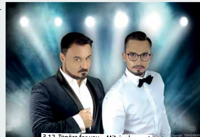
3.12. Tenöre for you – Mitsingkonzert

mittelalterlichen Burgküche. Wer hätte das gedacht? Bereits im Mittelalter war Geflügel eine äußerst beliebte Speise. Natürlich ein wenig anders zubereitet als heutzutage. Bei diesem Kochkurs werden verschiedene mittelalterliche Gerichte neu entdeckt. Auch wenn im gemütlichen Ambiente der Burgküche gekocht wird,