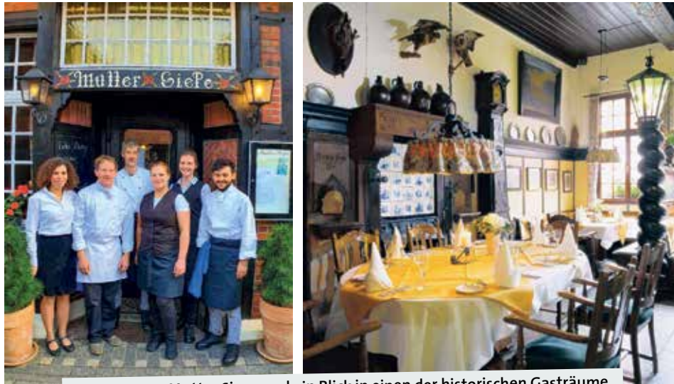
Das Team von Mutter Siepe und ein Blick in einen der historischen Gasträume.