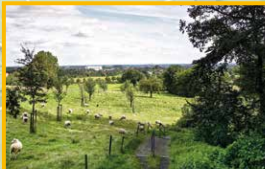
Aussicht vom Rosengarten auf Lüdinghausen