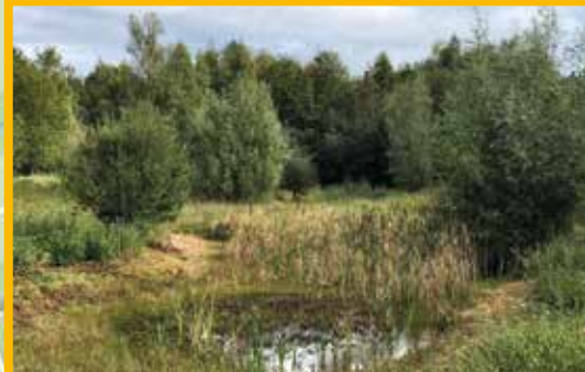
Das Lippsche Holt