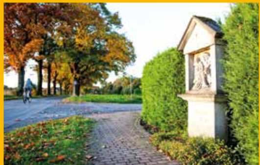
Kreuzweg an der Wanderroute