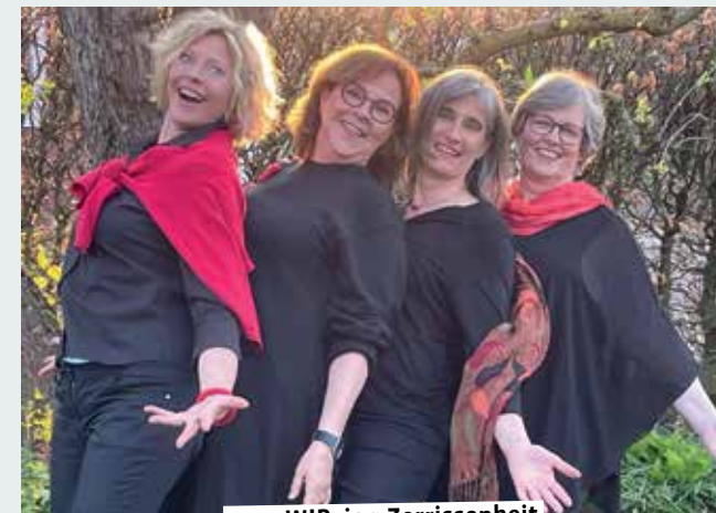
2.10. WIRvier: Zerrissenheit

8.00 bis 12.30 – Wochenmarkt. 16.00 bis 20.00 – Abendmarkt. Einkaufen, genießen und verweilen im schönen Innenhof der Burg Lüdinghausen. Veranstalter: Lüdinghausen Marketing 19.00 – Gute Geister. Welt der Weinbrände. Eintritt: 59,50 Euro; Wein Stork, Tickets gibt es online: → www.wein-stork.de