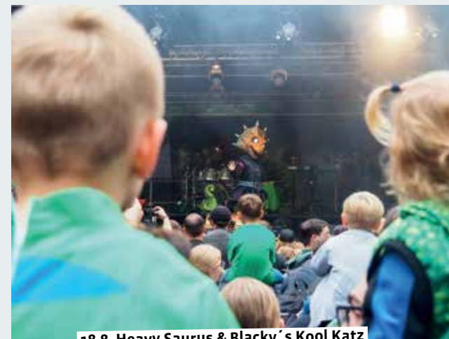
18.8. Heavy Saurus &amp; Blacky´s Kool Katz

19.00 – Whisky-Club: Best Of. Eintritt: 64,50 Euro Wein Stork (Tickets gibt es online: → www.wein-stork.de ) 19.30 – Lüdinghauser Fledermausnacht. Das Programm richtet sich an Erwachsene und an Jugendliche ab 7 Jahren. Taschenlampe für den Heimweg bitte mitbringen. Gebühr: Spende erbeten. Anmeldung: info@biologisches-zentrum.de