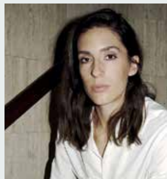
29.10. Tennisstar und Autorin Andrea Petkovic

Einkaufen, genießen und verweilen im schönen Innenhof der Burg Lüdinghausen. Veranstalter: Lüdinghausen Marketing 20.00 – Offene Nachtwächterführung. Start am Lüdinghaus. Ticket 12 Euro (erm. 5 Euro). Veranstalter: Lüdinghausen Marketing