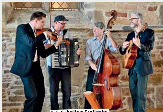
6.9. Schpilt a Frejlachs

19.00 – Wein & Wort. Arno Strobel liest Stalker – Er will Dein Leben. Die Lesereihe „Wein & Wort – erlesener Ort“ verbindet spannende Autoren, die an ungewöhnlichen Orten aus ihren Werken lesen und Einblicke in ihre Arbeit geben. Dazu gibt es eine Weinbar für genussvolle Momente vor und während der Lesung. An diesem Abend gibt es Nervenkitzel pur im Cinemotion Lüdinghausen. Eintritt: 18 Euro Tickets gibt es online: → www.wein-stork.de