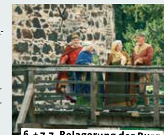
6.+7.7. Belagerung der Burg

Antreten aller vier Seppenrader Kompanien, anschließend Vogel-schießen, 20 Uhr Festball mit neuem Königspaar und der Liveband Motion 13.00 bis 17.00 – Offener Sonntag-nachmittag. Jeweils am 1. und 3. Sonntag im Monat von Mai bis September ist der Garten des Biologischen Zentrums zusätzlich zu den normalen Öffnungszeiten geöffnet. Ein Mitarbeiter ist anwesend, um Fragen der Besucher zu beantworten. 11.00-17.00 – Burg Lüdinghausen ist für Besucher geöffnet. Freunde der Burg (immer sonntags bis Ende Oktober)