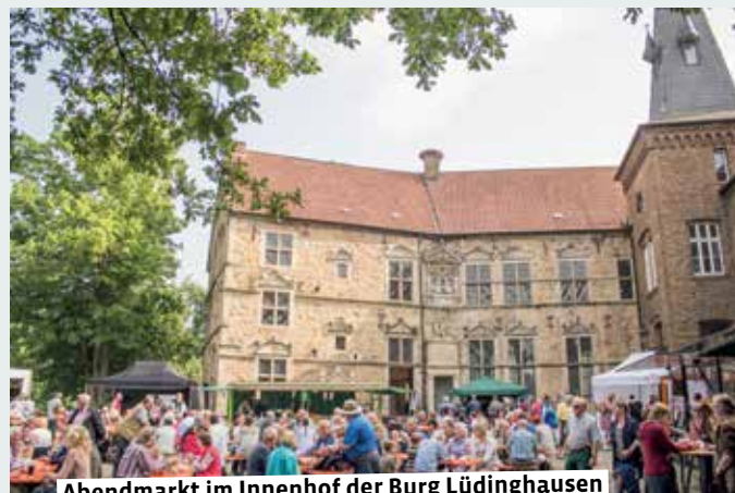
Abendmarkt im Innenhof der Burg Lüdinghausen

19.30 – Irischer Abend. Gemütliche Abendveranstaltung zu Klängen der Gruppe „Glengar“ und mit Guinness. Karten gibt es ausschließlich an der Abendkasse,