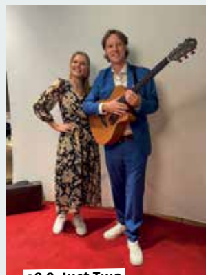
28.8. Just Two

8.00 bis 12.30 – Wochenmarkt. 16.00 bis 20.00 – Abendmarkt. Einkaufen, genießen und verweilen im schönen Innenhof der Burg Lüdinghausen. Veranstalter: Lüdinghausen Marketing 17.00 bis 20.00 – Live Painting mit Marius Stutte. Burg Vischering