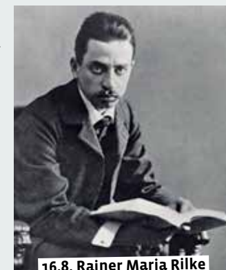
16.8. Rainer Maria Rilke