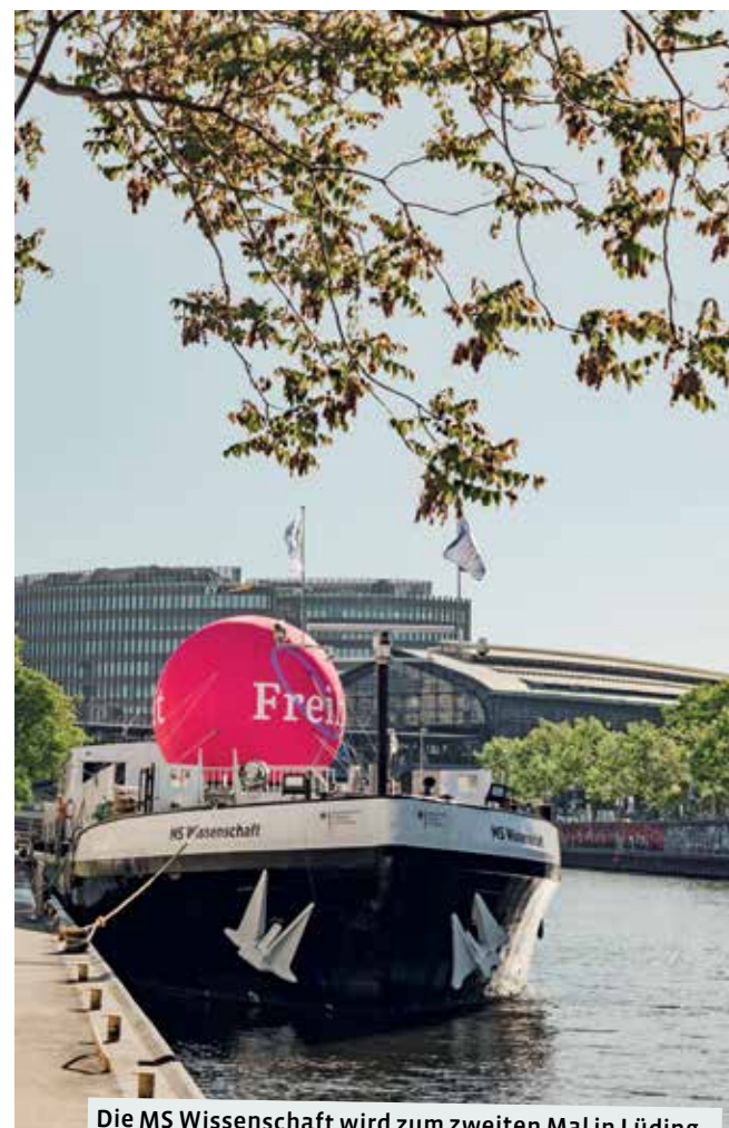
Die MS Wissenschaft wird zum zweiten Mal in Lüdinghausen anlegen und mit interaktiven Exponaten zum Ausprobieren und Lernen anregen.

die Gegenwart können Ausstellungsgäste ihr Wissen testen. Die Ausstellung wird ab zwölf Jahren empfohlen. Der Eintritt ist frei. „Die MS Wissenschaft transportiert Bildung auf eine spielerische und eingängige Art und Weise“, so Mertens. „Somit macht es auch in den Ferien Spaß, neue Dinge zu lernen und auszuprobieren. Ich freue mich sehr darüber, dass das Schiff unsere Stadt nun bereits zum zweiten Mal in seine Tour integriert.“ Die MS Wissenschaft tourt im Auftrag des Bundesministeriums für Bildung und Forschung durch Deutschland. Wissenschaft im Dialog (WiD) realisiert die Ausstel-